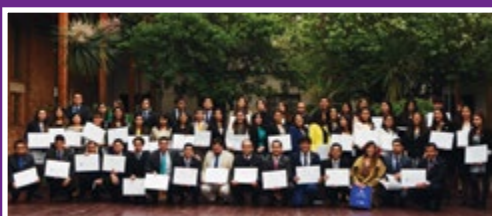
Ingeniería en Comercio Internacional