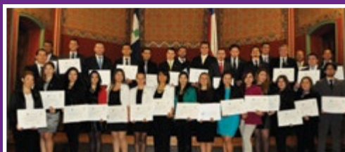
Ingeniería en Comercio Internacional Ingeniería de Ejecución en Comercio Internacional