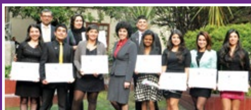
Ingeniería en Gestión Turística

Les deseamos mucho éxito y felicitamos a quienes cerraron de esta forma una de las etapas más importantes de sus vidas.